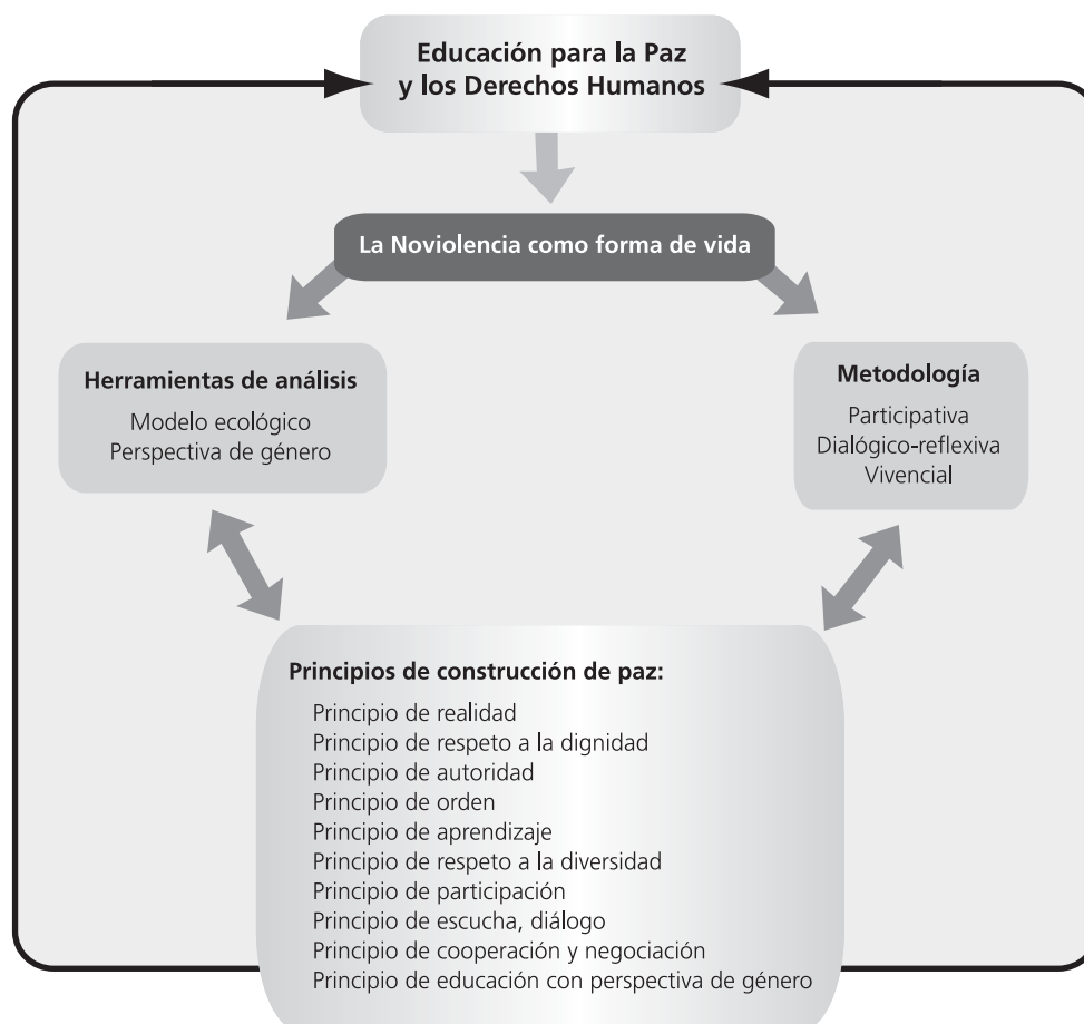
Esquema 1. Guía conceptual-metodológica

en Juventud por la Paz se han elaborado 10 principios para la construcción de paz, 10 y que incluyen los valores y las herramientas mínimas para dicho objetivo. Éstos son: de realidad, de respeto a la dignidad, de autoridad, de orden, de aprendizaje, de respeto a la diversidad, de participación; de escucha, diálogo y empatía; de cooperación y negociación, y de educación con perspectiva de género.